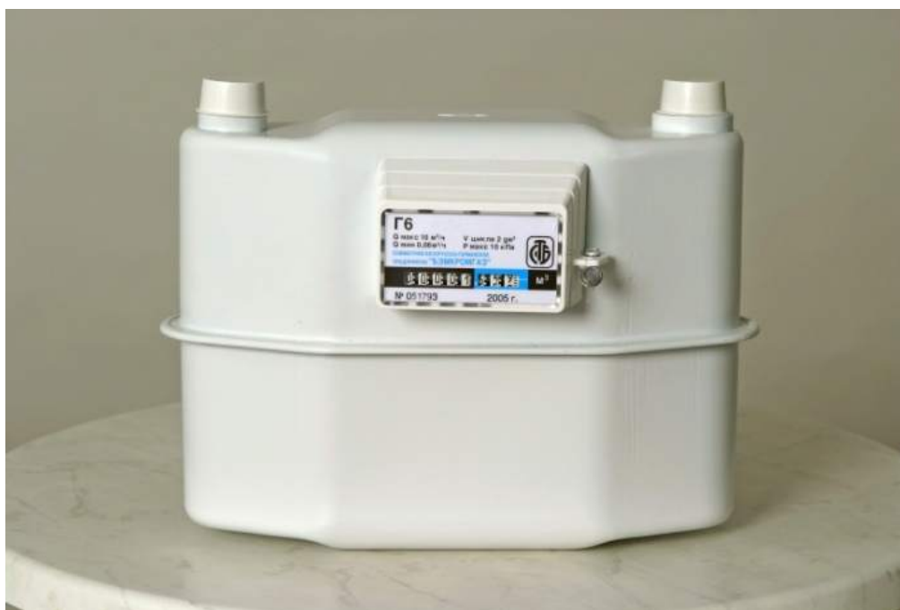
Фотография общего вида