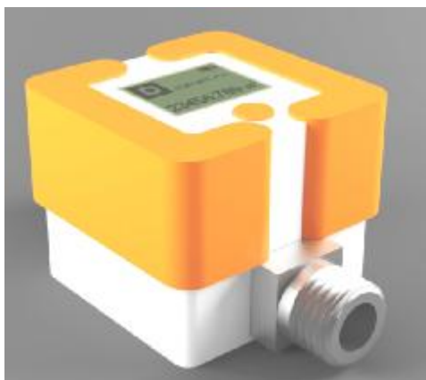
Рисунок 1 – Внешний вид счетчиков газа СГБ-1,8

Внешний вид счетчиков представлен на рисунке 1, схема пломбирования – на рисунке 2.