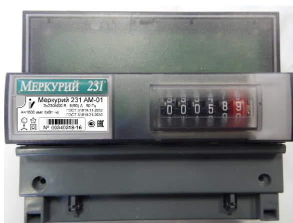
Рисунок 1 - Общий вид счетчика электрической энергии трехфазного статического «Меркурий 231АМ-01»

Общий вид счетчика электрической энергии трехфазного статического «Меркурий 231АМ-01» представлен на рисунке 1.