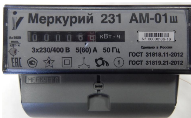
Рисунок 2 - Общий вида счетчика электрической энергии трехфазного статического «Меркурий 231АМ-0Хш»

Общий вида счетчика электрической энергии трехфазного статического «Меркурий 231А-0Хш» представлен на рисунке 3.