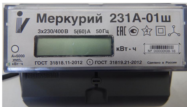
Рисунок 3 - Общий вида счетчика электрической энергии трехфазного статического «Меркурий 231А-0Хш»

Общий вида счетчика электрической энергии трехфазного статического «Меркурий 231А-0Хш» представлен на рисунке 3.