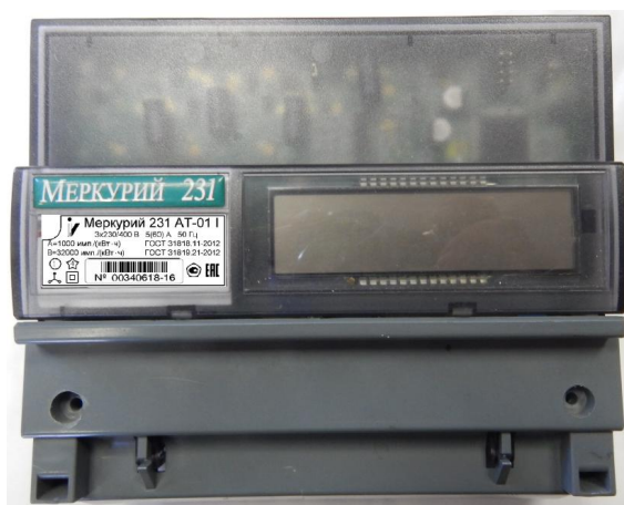
Рисунок 4 - Общий вида счетчика электрической энергии трехфазного статического «Меркурий 231А(Р)(Т)-0Х»

Общий вида счетчика электрической энергии трехфазного статического «Меркурий 231А(Р)(Т)-0Х» представлен на рисунке 4.