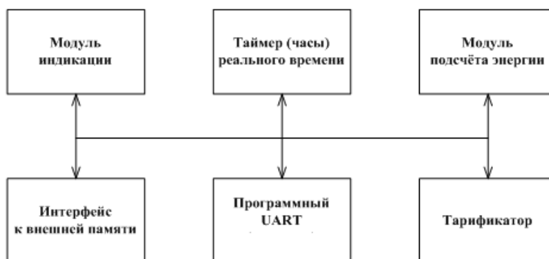
Рисунок 7 - Структура программного обеспечения «Меркурий 231»

Уровень защиты программного обеспечения «высокий» в соответствии с Р 50.2.077-2014.