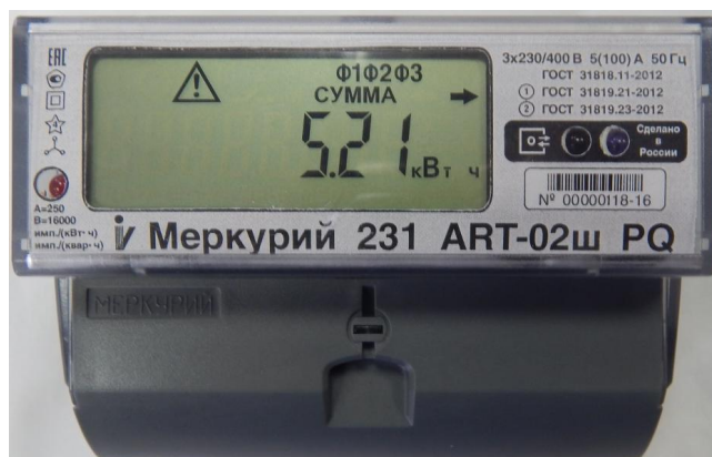
Рисунок 5 - Общий вид счетчика электрической энергии статического трехфазного «Меркурий 231А(Р)Т-0Хш»

Схемы пломбировки от несанкционированного доступа, обозначение места нанесения знака поверки знака поверки представлены на рисунке 6.