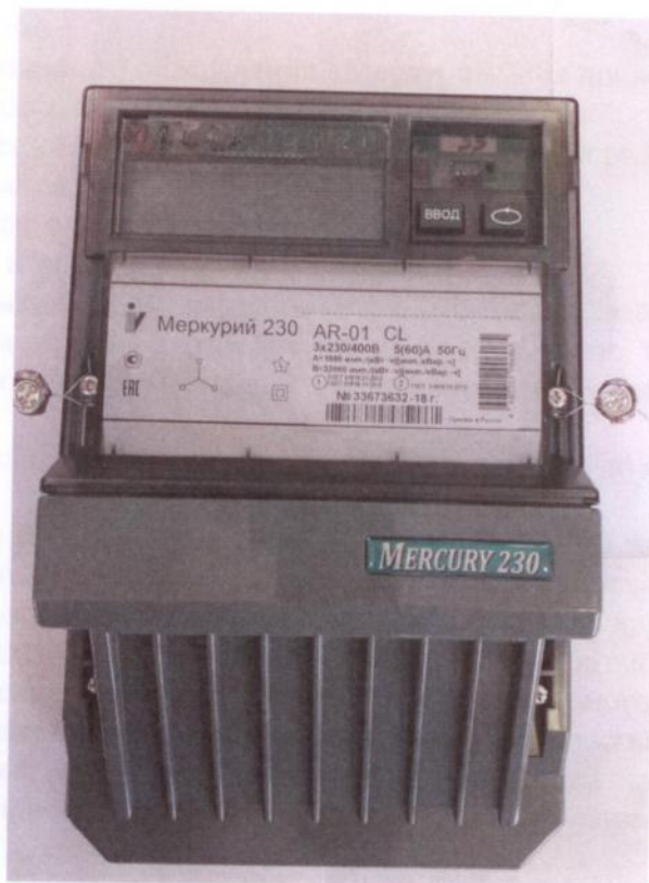
Рисунок 1 - Общий вид счетчика

Схема пломбировки от несанкционированного доступа, обозначение места нанесения знака поверки представлены на рисунке 2.