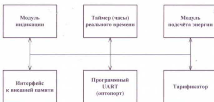
Рисунок 3 - Структура программного обеспечения «Меркурий 230»

Уровень защиты программного обеспечения от непреднамеренных и преднамеренных изменений «высокий» в соответствии с Р50.2.077-2014.